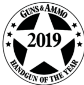
2019 - Handgun Of The Year TX 22