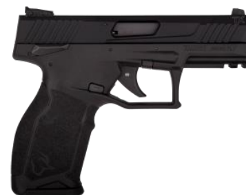
2019 - Handgun Of The Year TX 22