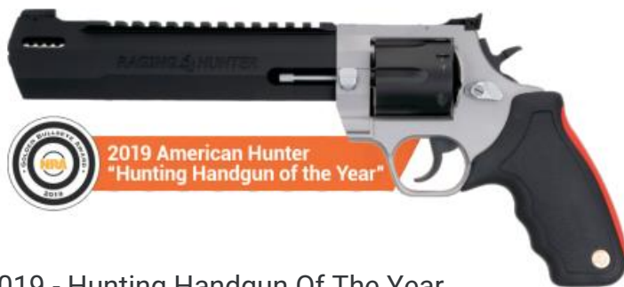
2019 - Hunting Handgun Of The Year RT 44H Raging Hunter